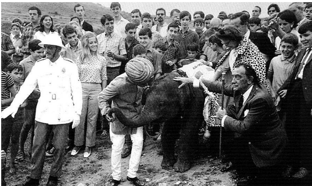
Surus et Salvador Dali lors de la parade à Figueras, 22.09.1967.

L'arrivée de Surus à Figueras et sa réception par Salvador Dali fut l'objet d'une manifestation publique le 22 septembre 1967. A défaut de traverser les Pyrénées sur son dos, Dali organisa une parade avec l'éléphanteau depuis une colline jusqu'à la ville de Figueras située en contrebas, symbolisant ainsi le passage des Pyrénées. Surus fut par la suite confié au zoo de Barcelone.