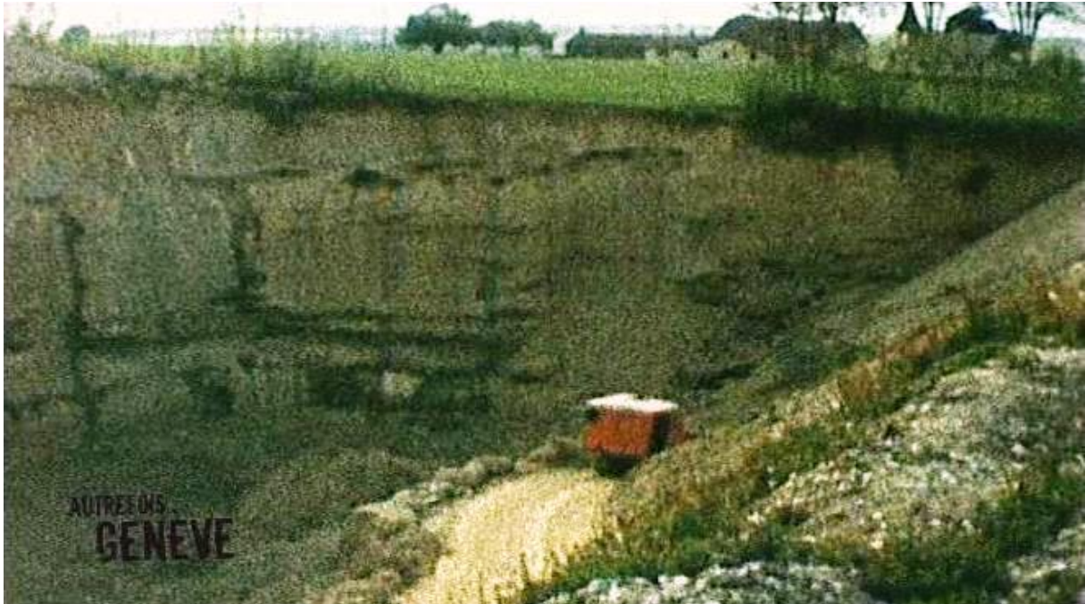
La gravière Moret en 1960. Capture d'écran du film de L. Payot sur la construction de la cité.

Meyrinois : on projette d'y implanter le centre sportif. Les membres du Comité de coordination de la cité-satellite (comité de pilotage) et l'Etat entament alors de longues négociations avec M. Moret. Ce n'est qu'en septembre 1964 qu'une convention est signée, mettant fin à l'exploitation de la gravière et fixant un délai pour son remblayage complet (une partie avait déjà été comblée dès 1961 avec les déblais des travaux de terrassement des immeubles des sociétés immobilières Meyrin-Parc et Ciel-Bleu).