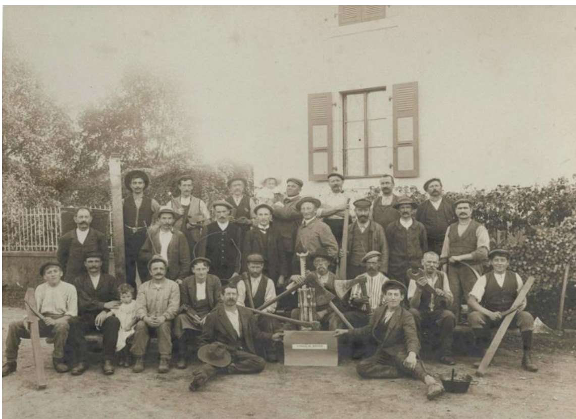
Les ouvriers de la fabrique de bois de fusils Barth, début du XXe s.