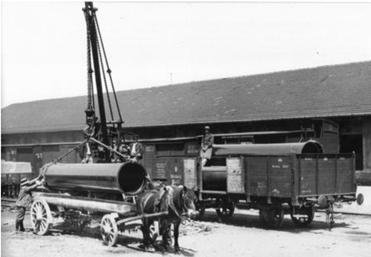
Cette scène de déchargement à la gare de Meyrin en 1912 devait ressembler à celle des billes de bois pour l'usine Barth.

L'implantation de cette industrie à proximité de la gare n'était pas due au hasard : c'est par le train en effet qu'arrivaient régulièrement (quotidiennement si l'on en croit un article de presse) à Meyrin les billes de bois nécessaires à la fabrication des bois de fusils. Certains troncs de noyers provenaient du canton de Vaud et pouvaient peser jusqu'à 12 tonnes 4 . Il devait donc régner une activité assez importante à la gare de Meyrin, avec un travail pénible à la clé pour les ouvriers de gare chargés de décharger les billes de bois à une époque où il n'existait pas de grues électriques.