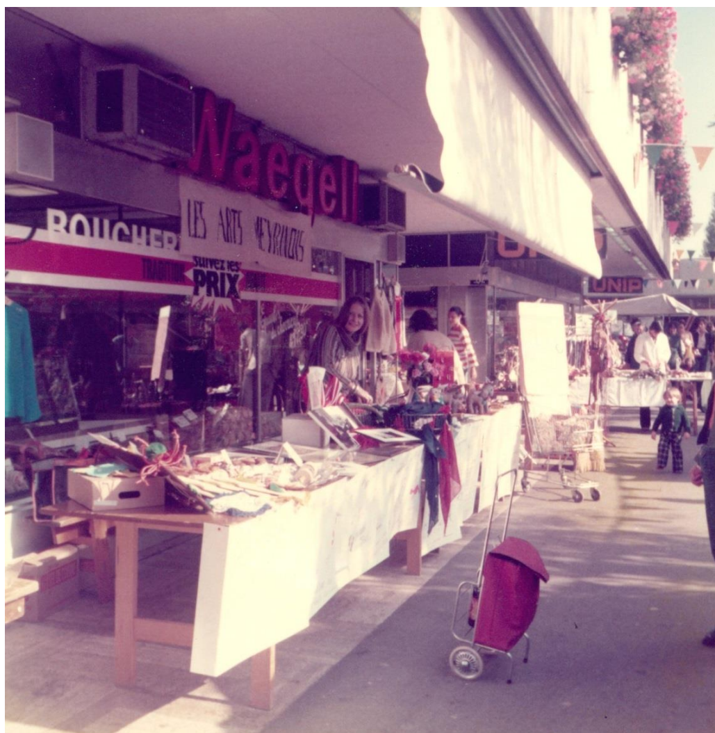
La « fête villageoise » en 1977, collection Sasa Hayes.

De 1969 au début des années 80, le premier week-end d'octobre était un rendez-vous incontournable pour les Meyrinois : c'était la « Fête villageoise » organisée par l'association des commerçants du Centre commercial. Si cette manifestation avait évidemment un but commercial, elle n'en dépassait pas moins ce cadre pour devenir, par les animations proposées, une véritable « fête de Meyrin ». La fête se déroulait sur trois jours, dans les allées en plein air du centre commercial qui était alors formé de trois bâtiments distincts, devant et derrière le centre, mais également sur le terrain où s'élève actuellement Forum Meyrin, qui accueillait des manèges. Cette fête foraine ne se limitait pas à des carrousels pour enfants mais en proposait certains du style grande roue ou « Bidule ».