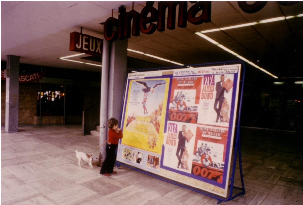
Devant l'entrée du cinéma Cosmos. Années 1970.