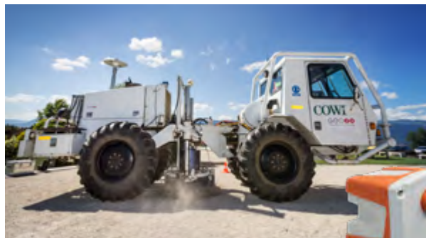
Camion vibreur et capteur «géophone» utilisés lors de la phase de prospection.

GEothermies vise à améliorer la connaissance du sous-sol genevois et à élaborer le cadre institutionnel favorable au développement de cette énergie. Piloté par l'Etat de Genève, ce programme est financé et mis en œuvre par SIG. Il est articulé en trois phases: la prospection, l'exploration par forage et l'exploitation.