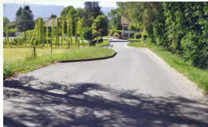
Entrée du hameau de Mategnin aujourd'hui

Trois interventions prioritaires potentielles ont été définies le long des fermes de Mategnin : sur la route de Prévessin, au bois de la Citadelle, et sur le terrain dit de l'Étang au sud du quartier de la Citadelle.