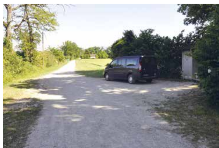
Situation actuelle vers l'ancienne douane