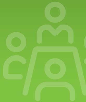
TABLE RONDE ÉCONOMIE VERTE METTRE LA TRANSITION EN MOUVEMENT