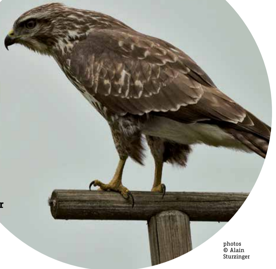
La buse variable