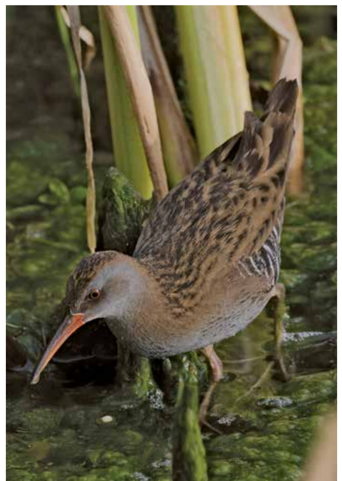
Le râle d'eau