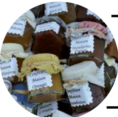
CCO Domaine public