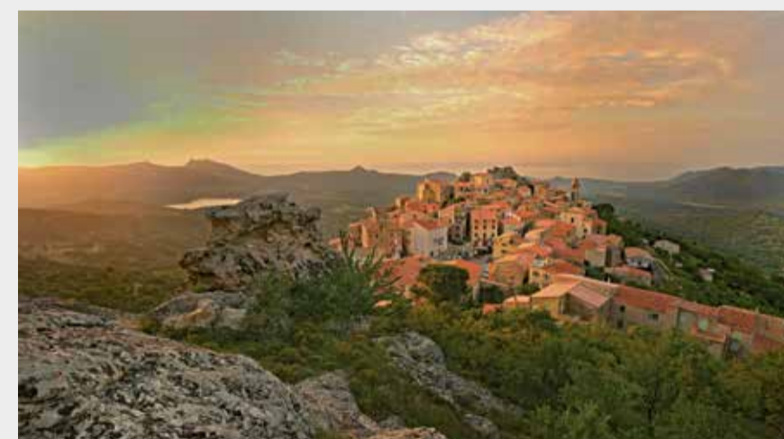
Le village de Speloncato