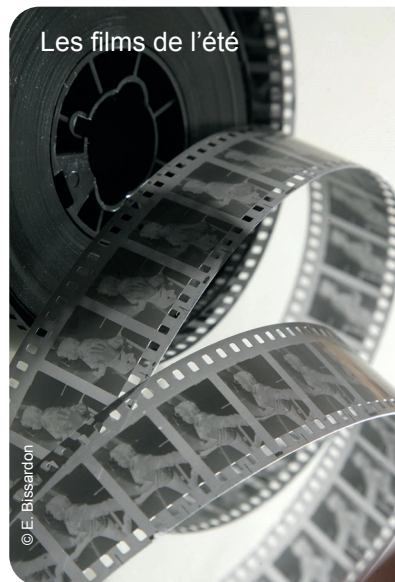
Les films de l'été