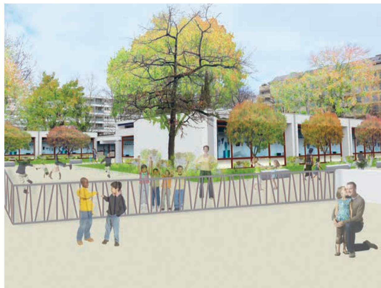
Les préaux extérieurs de l'école de la Golette seront intégralement rénovés