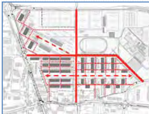
Mobilités douces : un réseau piétons hiérarchisé

→ Mobilité - Branchés sur l'axe fort du tramway (TCMC et Diredtissima), les quartiers seront également desservis par deux lignes de bus. La part belle sera faite aux mobilités douces, avec un réseau dense de cheminements pour les piétons et les cyclistes et de nombreuses places de stationnement pour vélos. Le stationnement privé sera concentré dans trois parkings en sous-sol, situés notamment sous les esplanades des quartiers des Vergers et des Arbères. Un stationnement public limité sera disponible en surface sur la promenade des Vergers.