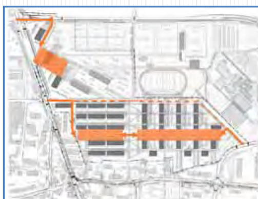
Stationnement privé concentré en sous-sol : peu d'accès, peu de places publiques en surface (traitillé)