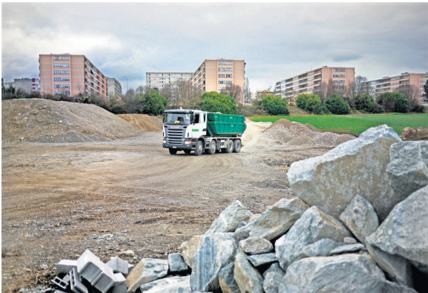
Le lac sera construit au lieu-dit Les Vernes, près des Champs-Frêchets et du futur quartier des Vergers.