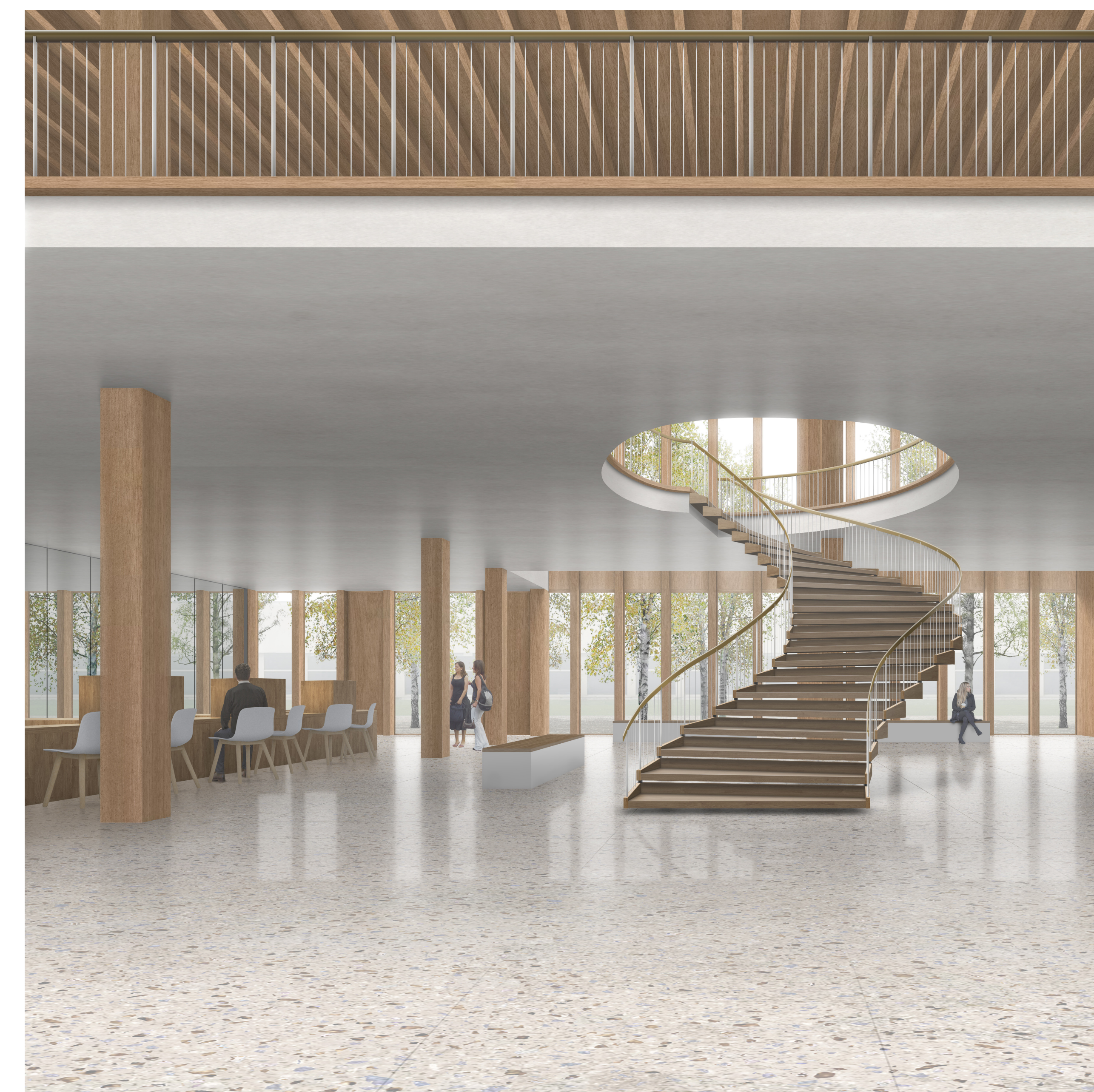
Le hall d'entrée de la mairie