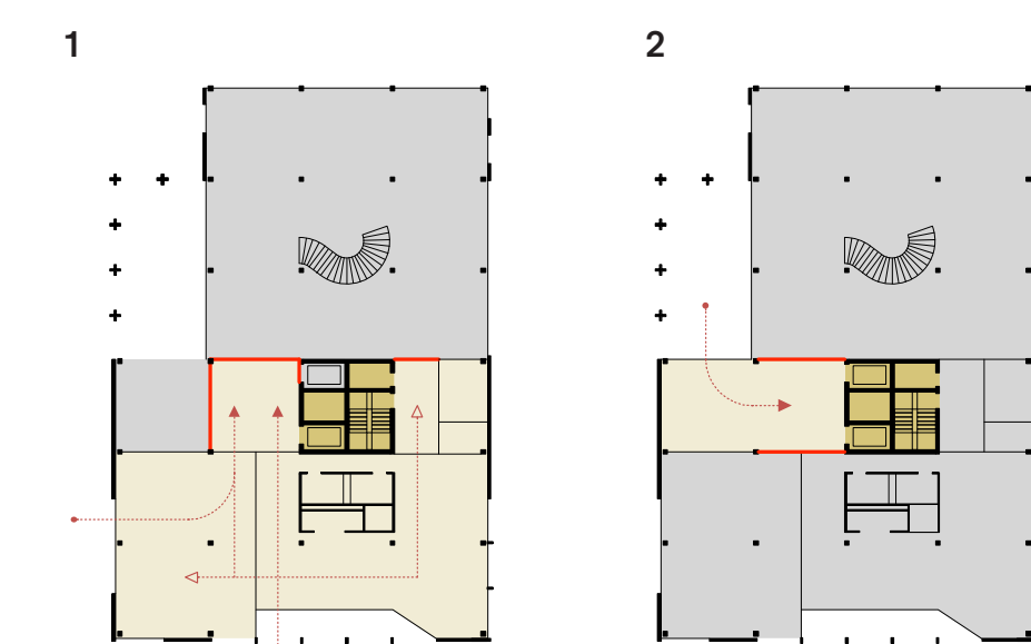
Hors des horaires d'ouvertures: indépendance d'accès du public au rdc et au 6e étage (1) et du personnel aux bureaux (2)