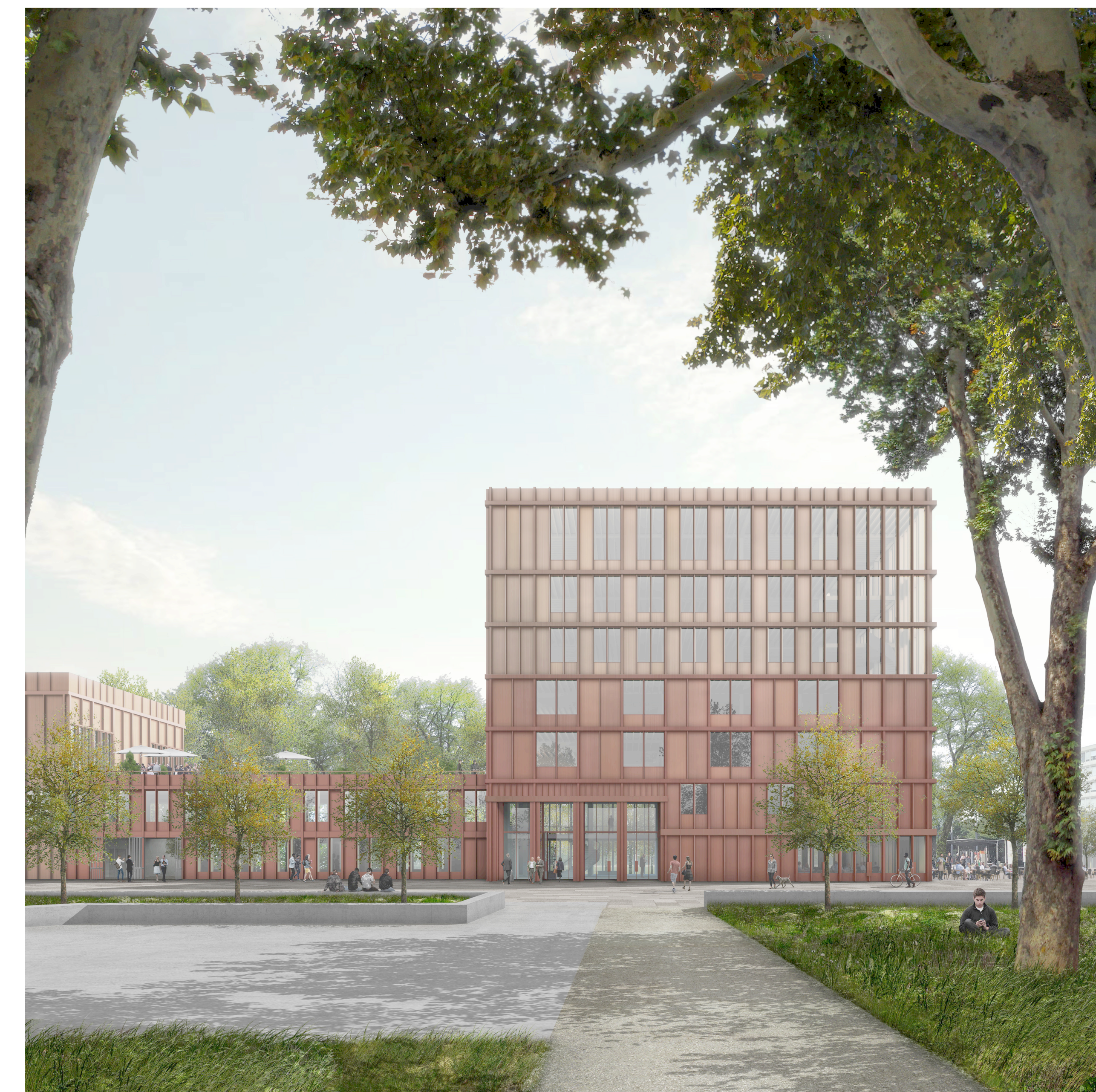
L'arrivée à la mairie depuis le parc