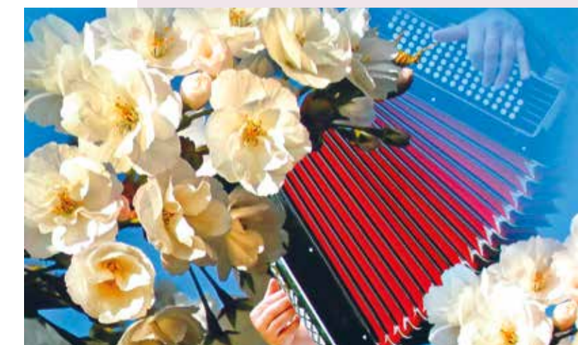
Extrait de la rupture - C. Hendricks B.

Exposition photo Une exposition photo des membres du CAPM visible au foyer central de ForuMeyrin accompagnera la manifestation.