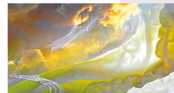
Extrait de mon réalisme magique - M. Batist