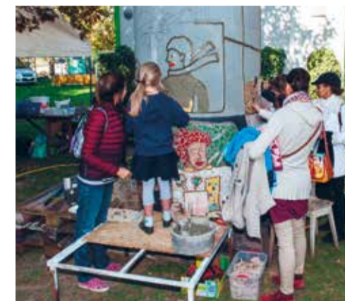
Totem maison du projet

Conférence débat: S'engager, s'entraider: citoyenneté et développement durable. Animation: APSC et Agenda 21.