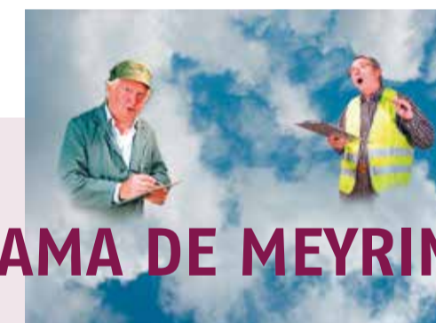
Les magasins du Ciel - Extrait de Le Crépuscule du 6 e jour - G. Hoiler

Barcelone, capitale de la Catalogne et plus grand port de la Méditerranée, est une ville de 2'000 ans d'histoire, façonnée particulièrement par deux styles issus de ses périodes de grande splendeur, le gothique à la fin du Moyen-âge et le Modernisme au début du XX e siècle. Deux styles que nous retrouvons aux îles Baléares (Minorque, Majorque, Ibiza, Formentera), quatre îles envahies par les Phéniciens, les Carthaginois, les Arabes et les Turcs, et conquises par les Catalans au XII e siècle.