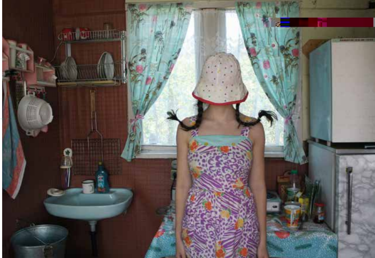
► Nonrandom randomness © Alena Zhandarova

Des photographes approchent l'adolescence au Forum Meyrin.