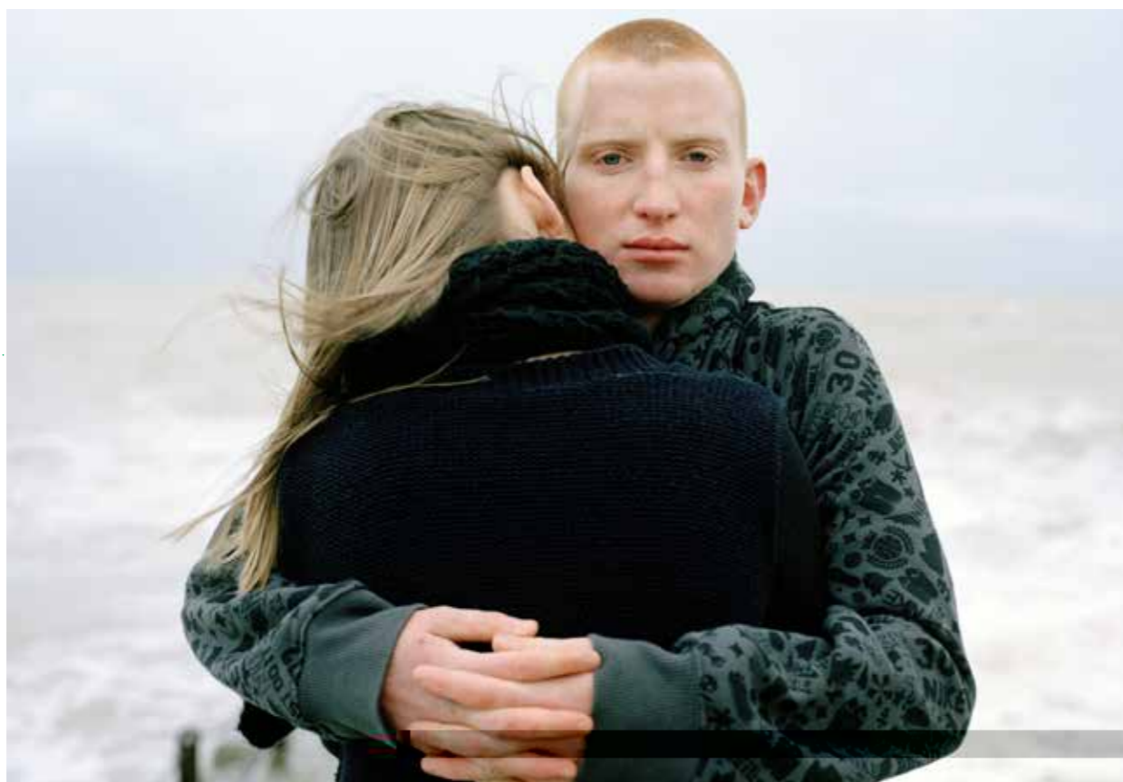
► Mouldy and Carla © Laura Pannack