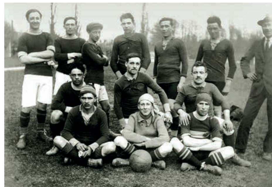
▲ La première équipe du Meyrin FC, en 1914

«Le Meyrin FC est une véritable entité, avec une forte identité. Le club a un président emblématique, au long cours, et de solides assises. Il s'est bâti autour d'une ville, puisque Meyrin en est devenu une. Sa place est importante, notamment au niveau de la formation. Aujourd'hui, nous mettons en place un partenariat entre clubs de la région. Un nouveau projet de rencontre, où les partenaires se parlent. Meyrin a un rôle essentiel à y jouer.»