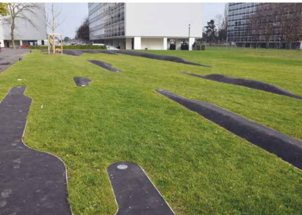
«L'enfance du pli» de Gilles Brusset

••• comprend la surprise des enfants de Meyrin-Parc qui croyaient peut-être qu'un minigolf était en train de se construire derrière l'école des Boudines, côté Meyrin-Parc. En effet, par le truchement de leurs parents, qui eux l'ont appris en lisant le Meyrin ensemble de décembre, ils savent maintenant qu'à la place d'un minigolf, c'est une œuvre d'art qui vient de naître. Un espace ludique et artistique hors pair. Les artistes urbanistes y reprennent les mouvements du Jura voisin. Des surfaces engazonnées et d'autres embitumées, reproduisant des creux, des vaux, et des plaines de nos montagnes. L'occasion de futures parties de cache-cache endiablées.