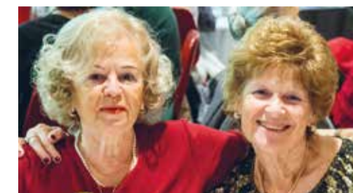
Le service des aînés

Le 25 novembre dernier a eu lieu le traditionnel repas en l'honneur des nonagénaires. Il s'est déroulé à la ferme de la Golette autour d'un repas de saison et d'échanges d'anecdotes et de souvenirs. Le 2 décembre, la célébration des anniversaires de mariage a eu lieu à l'hôtel Crowne Plaza. Le Conseil administratif s'est réjoui d'honorer dix-neuf couples qui fêtaient... 50 ou 60 ans d'union ! Enfin, le traditionnel Noël des aînés s'est tenu au Forum sur trois jours. Il a réuni plus de 1'000 personnes. Les chœurs des enfants de l'école De-Livron y ont entonné des chants de Noël autour de beaux moments de partage, tandis que l'école hôtelière de Genève œuvrait pour la première fois autour du repas. En voici quelques photos.