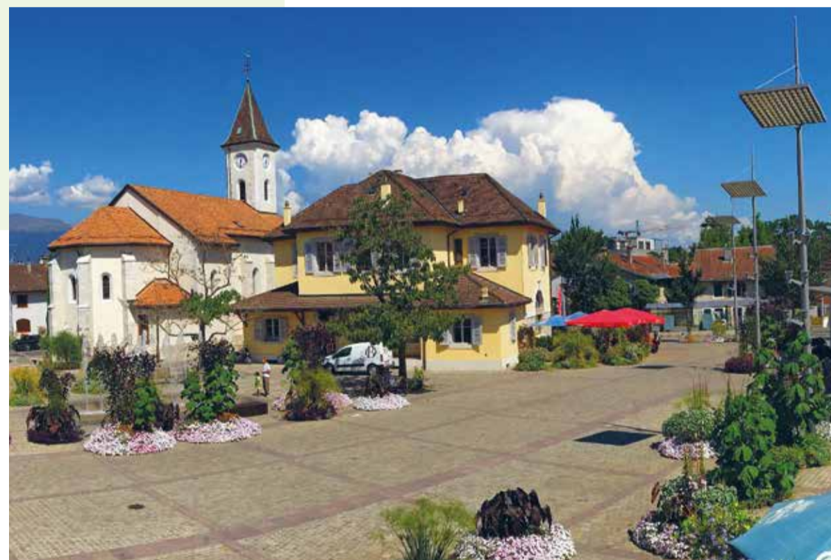
Aménagement éphémère Place de Meyrin-Village