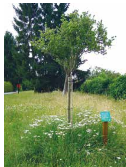
Prairie et jeunes arbres fruitiers de variétés suisses à l'école de Meyrin-Monthoux