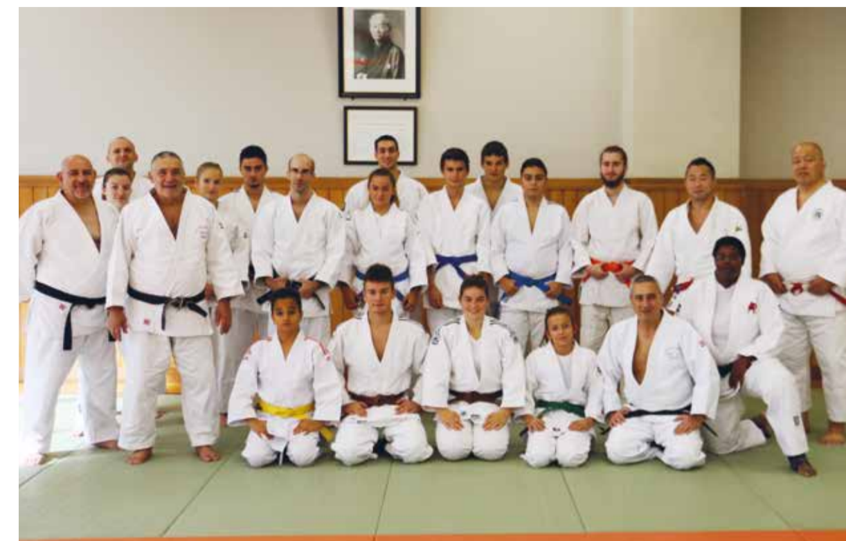
Moniteurs et élèves au Kodokan, avec leurs deux professeurs japonais

Informations: Judo club Meyrin club@judo-meyrin.ch www.judo-meyrin.ch