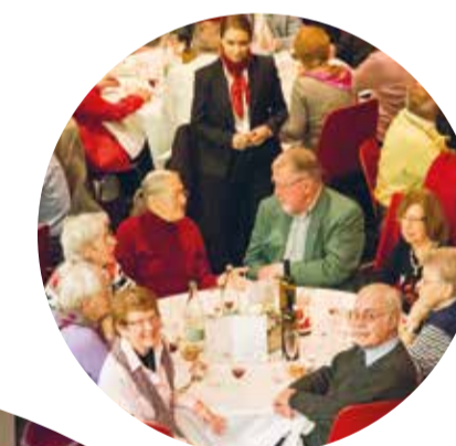
autres photos © Djoon Leuenerger