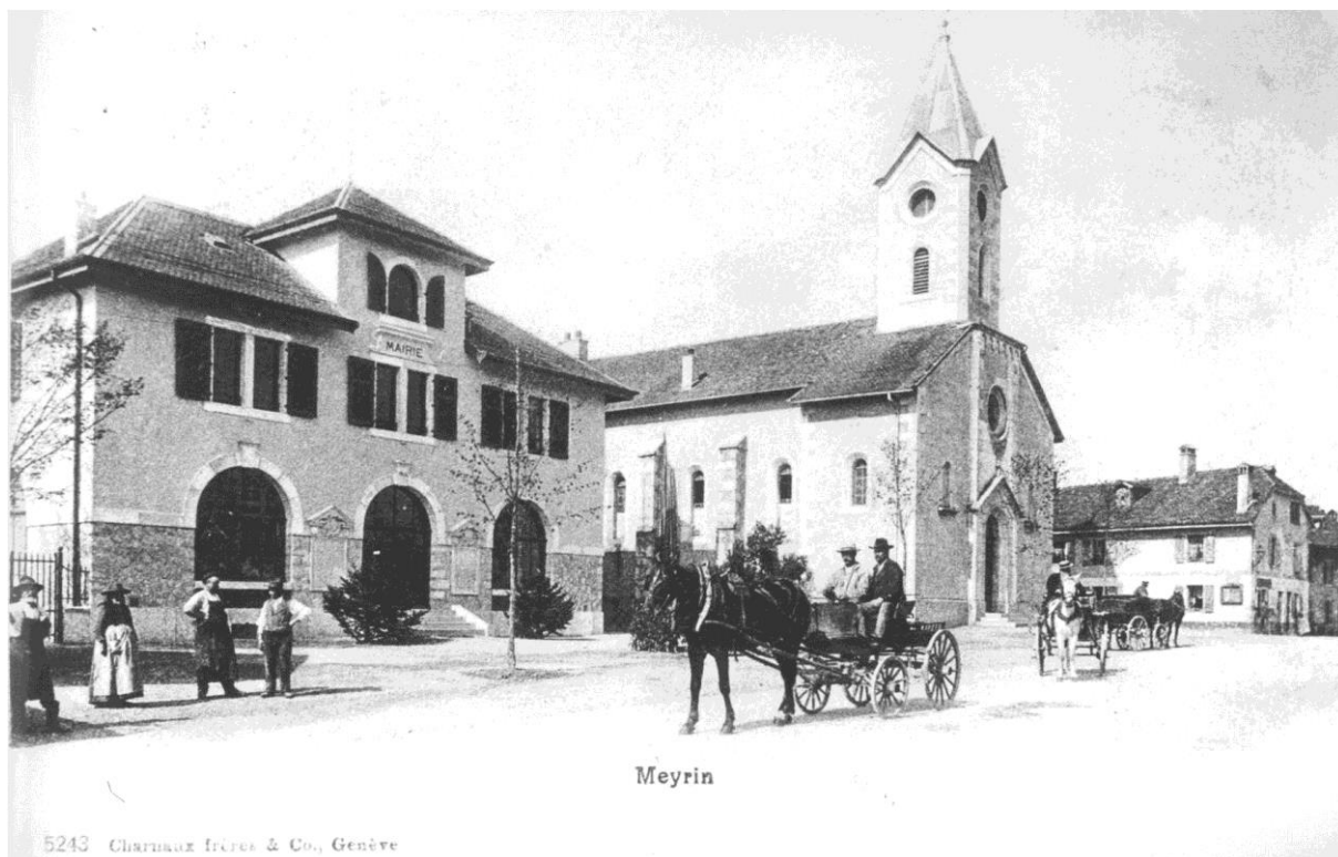
Carte postale des Frères Charnaux, vers 1910.