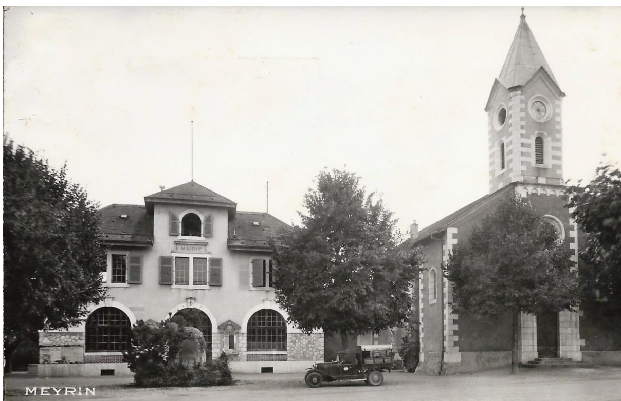
Mairie et église St-Julien dans les années 40.