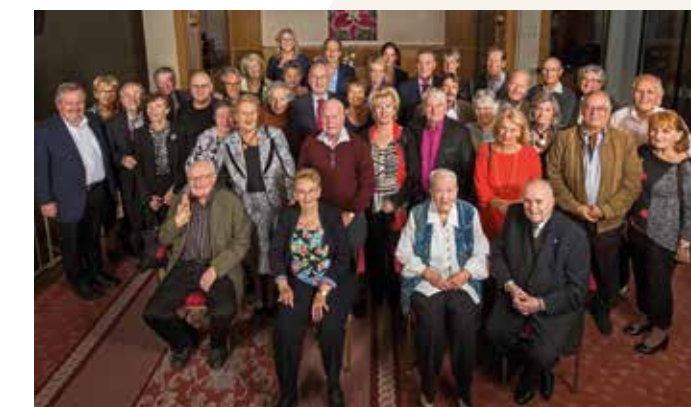
Fête des Jubilaires 2017