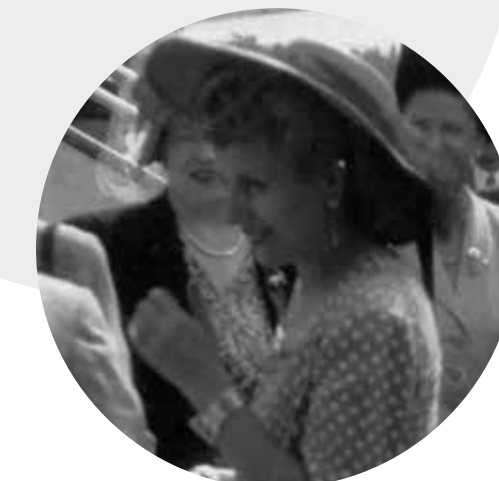
Remerciements à Jean-Claude Cailliez, historien de l'aviation