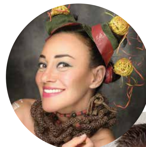
© MJ Cachero & Alexandre Cabrita