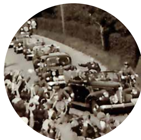
Le cortège de voitures de Churchill photographié depuis le Café de l'Aviation à Meyrin le 23 août 1946

L'avion de Churchill se pose à Cointrin dans l'après-midi du 23 août. Une foule importante s'est rassemblée pour l'accueillir. La réception officielle se déroule dans le hangar de l'aéroport en présence des autorités, puis Churchill et sa famille prennent place à bord d'une voiture ouverte. L'ancien ministre salue la foule qui l'acclame aux cris de «Vive Churchill!». Le cortège de voitures se met en marche et quitte l'aéroport pour rejoindre, par la route de Meyrin, les bords du Léman. Le cortège passe près du Café de l'Aviation, depuis le balcon duquel un membre de la famille Tremblet, propriétaire du café, prend une photographie (ci-dessous). La veille, le 22 août, Cointrin avait déjà accueilli officiellement le jeune roi du Siam Bhumibol, étudiant en droit à Lausanne. Celui-ci venait d'accéder à la royauté mais avait souhaité achever ses études en Suisse avant de rentrer exercer sa charge en Thaïlande.