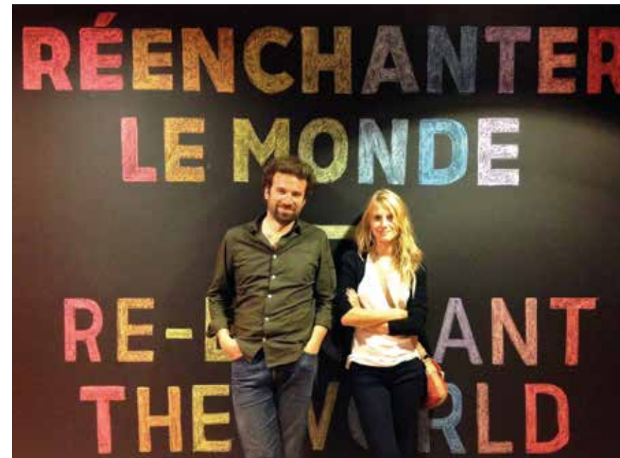
Cyril Dion et Mélanie Laurent, co-réalisateurs du film Demain