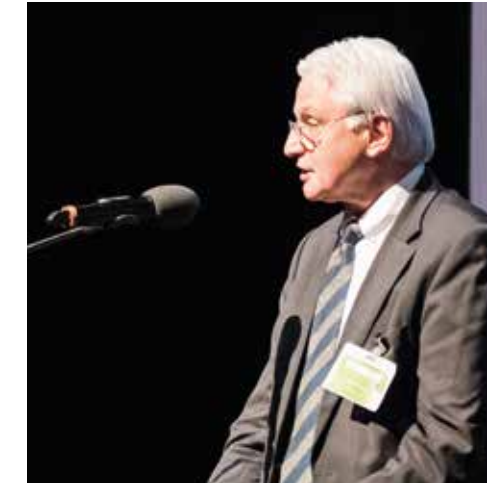
Succès pour l'édition 2018 du Meyrin Economic Forum

La solution suggérée par les organisateurs du MEF est l'innovation dite « ouverte ». Elle émerge de la « collaboration ouverte » entre acteurs divers : organisations internationales, PME, startups, académies, collectivités publiques. Selon ce modèle, l'« intelligence collective », soit le fait de réfléchir ensemble, permet d'être plus créatif et innovant, parfois aussi plus rapidement. Certaines conditions doivent toutefois être réunies.