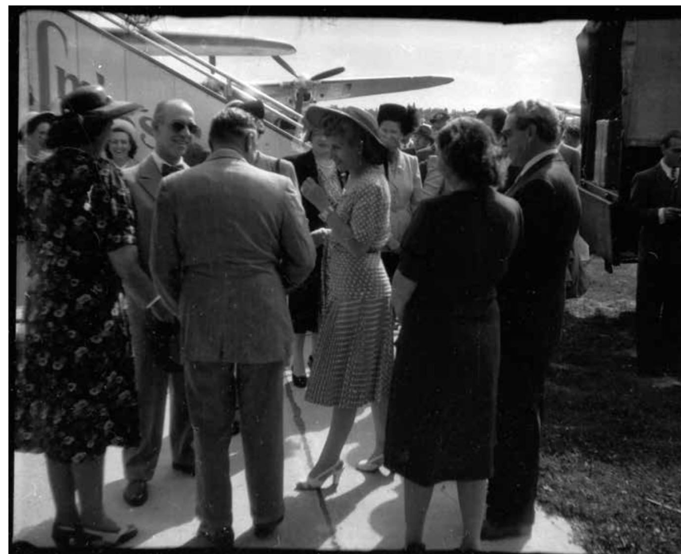
Eva Perón sur le tarmac de l'aéroport de Cointrin, 10 août 1947