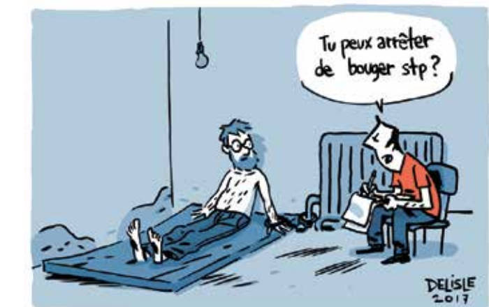
Le "making of" de l'album.

Une exposition, visible au Jardin botanique alpin, présente les BD-reportages réalisés par les étudiants. L'ensemble des planches ainsi que des originaux de Guy Delisle seront également à découvrir dans le patio de la salle communale de Plainpalais durant le festival. Une occasion unique de découvrir Meyrin d'une façon originale.