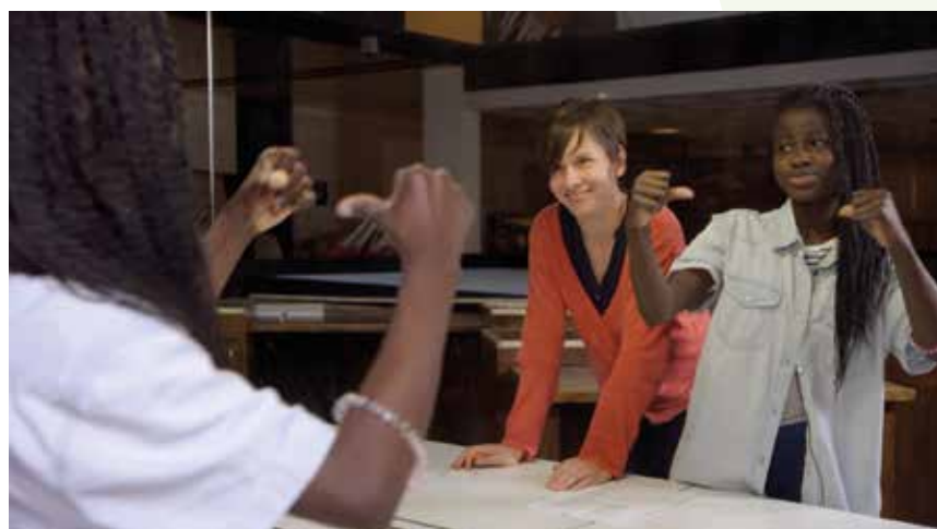
Un jour ça ira