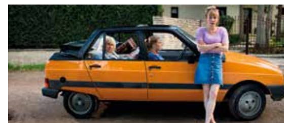
Crash Test Aglaé

Cinemas du Grütli Projection suivie d'une discussion, en collaboration avec le Jardin des disparus et la ville de Meyrin Billetterie FIFDH