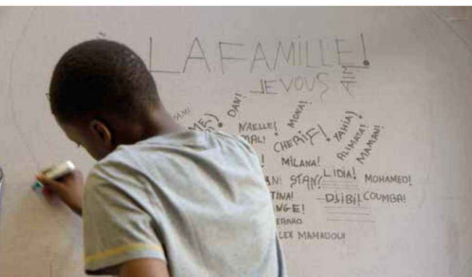
Un jour ça ira

Aula de l'école des Boudines Entrée libre Projection suivie d'une discussion avec les réalisateurs