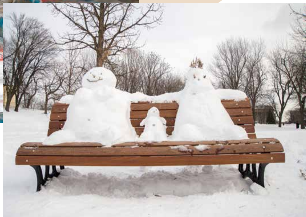
Flâneurs après le passage de la déneigeuse.

Le déneigement des routes, des trottoirs et des espaces piétonniers constitue une prestation importante du service de l'environnement auprès des habitants meyrinois pendant l'hiver. Les conditions parfois extrêmes dans lesquelles sont effectués ces travaux sont la source de nombreux risques, tant pour les travailleurs que pour les citoyens et les usagers. Claudio Angius nous les explique.